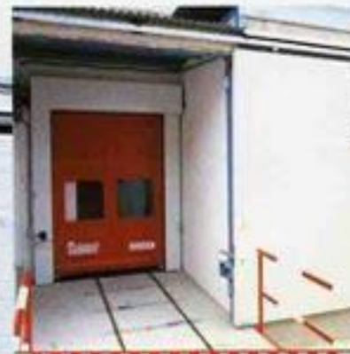
Automatització sincronitzada amb el trànsit de les vagonetes.