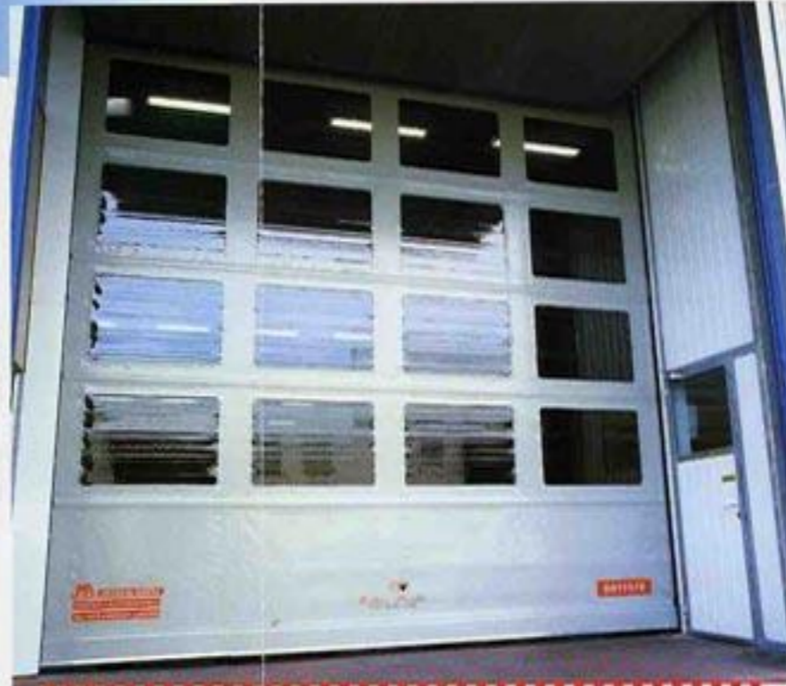
BATINSA / CELLERS PERELLÓ Conjunt de porta ràpida de lona amb acabat de color gris i porta de pas peatonal amb fixe lateral i superior que té incorporada una finestra de metacrilat per a la visibilitat.