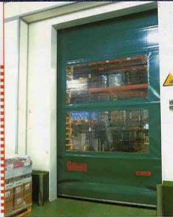
BATINSA / CASA WESTFAUJA Especialment útil per a les divisions interiors de nous de grans dimensions. Permeten la circulació constant de vehicles (transpalets, toros, ...) així com el manteniment de diferents temperatures per a cadascuna de les seccions d'una mateixa nau. En aquest cas, a una banda hi ha una sala frigorífica amb una temperatura mitjana de -5°C, i a l'altra, un magatzem on la temperatura es manté al voltant dels 20°C.