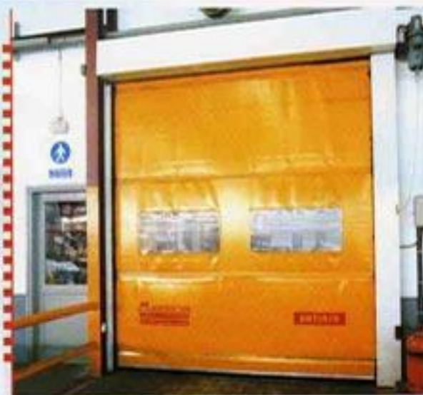
BATINSA / ACONDA PAPER A més de les característiques esmentades en la imatge superior, en aquest cas es va optar per aquest model de porta per evitar els grans corrents d'aire que es produeixen sovint en nous de grans dimensions i així poder mantenir una temperatura constant. El bon acondicionament del lloc de treball és el punt de partida per al rendiment òptim del personal.