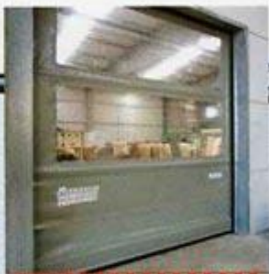
BATINSA / Surocork. Especialment útil per a les divisions interiors de nous de grans dimensions. Permeten la circulació constant de vehicles (transpalets, toros, ...) així com el manteniment de diferents temperatures.

Conjunt de portes de tancament interior i exterior. En primer pla una porta corredissa i una porta basculant industrial tipus sandvitx, ambdues folrades de doble capa lacada blanca i amb poliuretà expandit a l'interior. Especialment dissenyades per a alta seguretat del tancament de les obertures de les vies on s'ubiquen les portes ràpides de lona. Aquestes últimes són portes molt resistents a les inclemències meteorològiques i estan dotades de finestretes per a l'entrada de llum i per a la visibilitat.