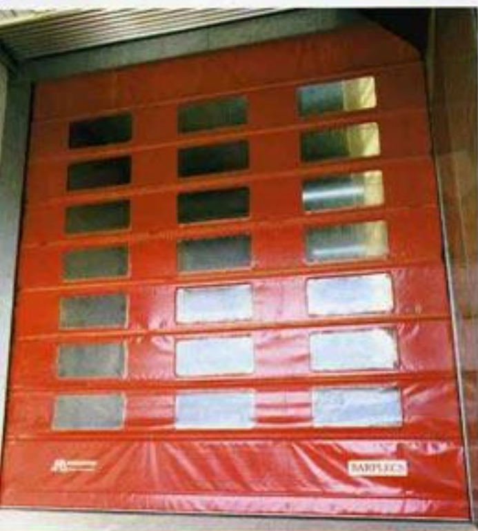
BARPLECS / TRAINCO GIRONA Tancament de magatzem de material elèctric.