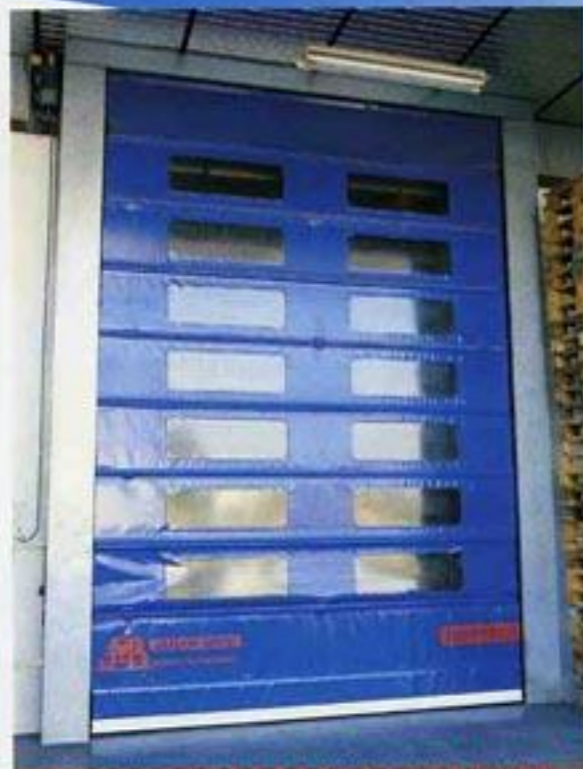
BARPLECS / DISCASA GIRONA Tancament de magatzem farmacèutic d'alta higiene.